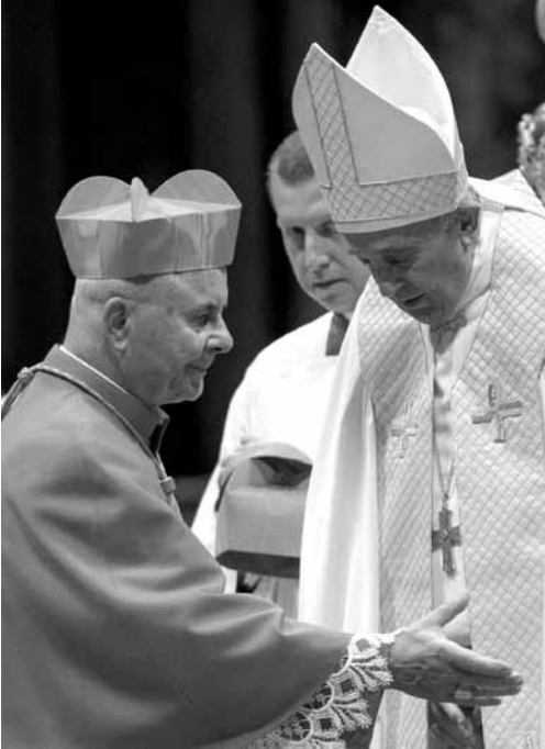
Kardinolas S. Tamkevičius SJ

Pilnaverčiam žmogaus gyvenimui yra reikalingos trys pamatinės dorybės: tikėjimas, viltis ir meilė. Be tikėjimo protingo žmogaus gyvenimas būtų tarsi kelionė audringa jūra be kompasu, kelionė naktį – be žiburio. Gyvenimas be meilės būtų ne gyvenimas, o tik liūdna žmogaus egzistencija. Tačiau ne mažiau už tikėjimą ir meilę mums reikalinga viltis.