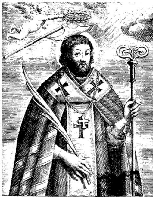
B. IOSAPHAT MARTYR

Juozapas atvedė daug naujų tikinčiųjų į Uniją