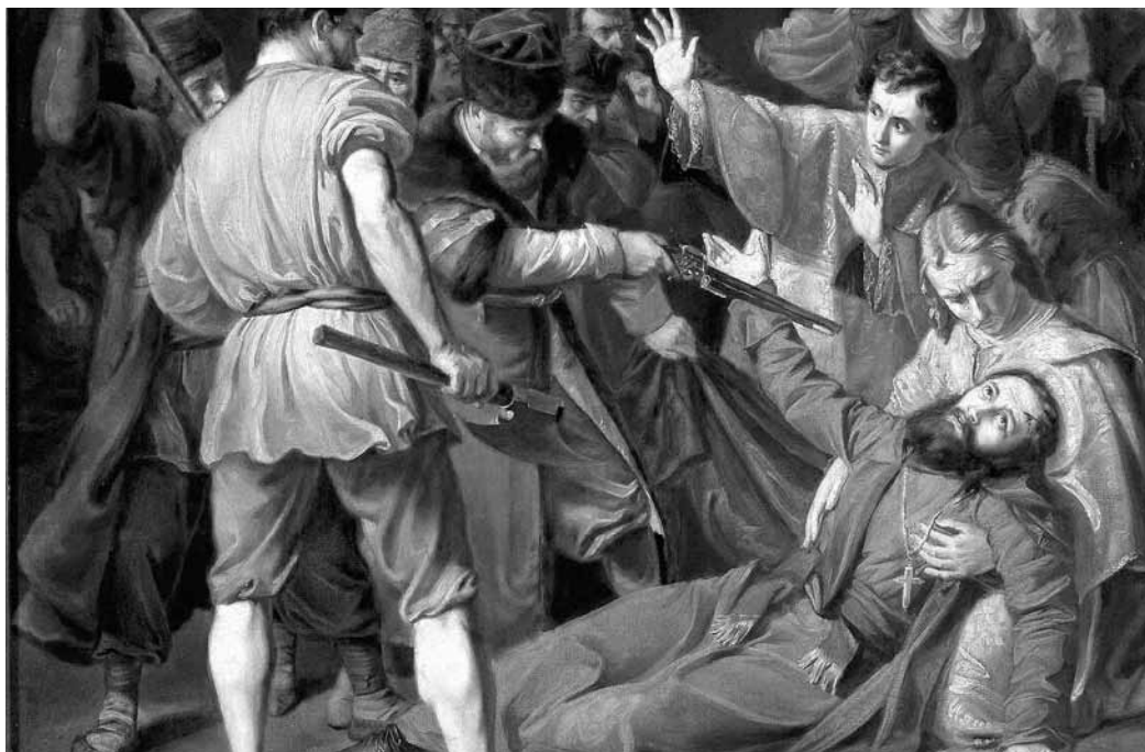
Józef Simmler. Šv. Juozapato kankinystė, 1861