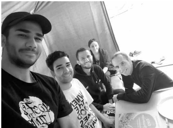
Poškonų pabėgėlių centre