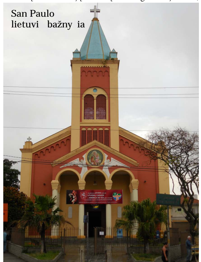
San Paulo lietuvi bažnyčia

San Paule mus priėmė vietos lietuviai. Buvo neįtikėtina nuskridus daugiau kaip 11 tūkstančių kilometrų ir atsidūrus visai kitame žemyne ir netgi kitoje žemės pusėje, rasti žmonių, kalbančių lietuviškai. Lietuvių parapija čia įkurta dar tarpukariu, bažnyčia pastatyta 1936 m. Visas rajonas, vadinamas Vila Zelina, buvo įkurtas lietuvių. Šiandien jų čia likę nedaug. Senoji karta,